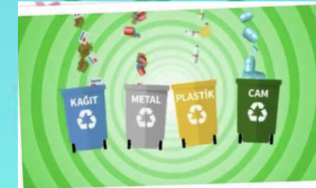
Sıfır Atık Şarkısı